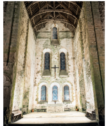
Travaux de mise en sécurité de l'abbaye et de l'éclairage de l'abbatiale